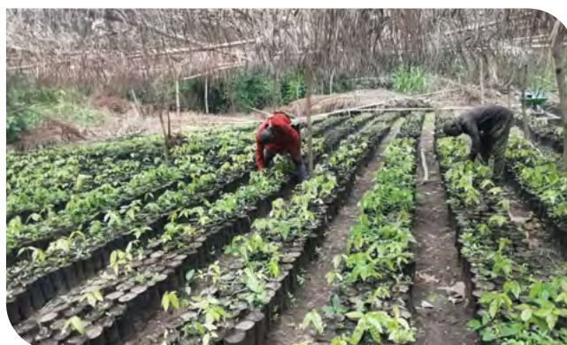
Pépinière de plants de cacao (ABOCFA - Ghana).