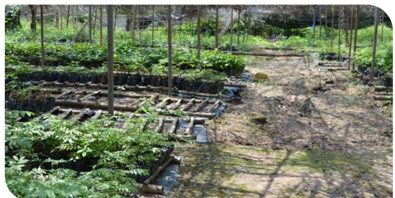
Une pépinière d'arbres forestiers, sous ombrage.