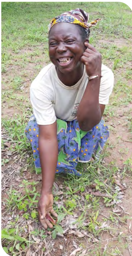
Une plantation réussie.

En régénérant des parcelles vieillissantes et en les enrichissant, grâce à l'agroforesterie notamment, les producteur-rices peuvent conserver des débouchés rémunérateurs et améliorer l'attractivité des filières cacao et karité pour les nouvelles générations.