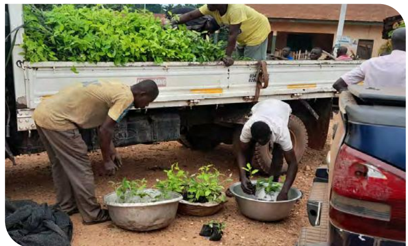
Livraison des plants commandés par les producteur-rices.